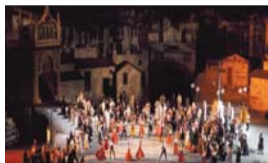
Mercoledì 24 Agosto ROMEO E GIULIETTA ALL'ARENA DI VERONA