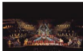
Venerdì 12 Agosto IL NABUCCO ALL'ARENA DI VERONA