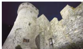
Domenica 15 Agosto MACUGNAGA E IL CASTELLO DI VOGOENA