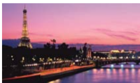
Dal 13 al 16 Agosto FERRAGOSTO A PARIGI