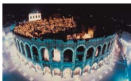
Sabato 2 Luglio LA TRAVIATA ALL'ARENA DI VERONA