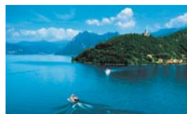
Domenica 3 Luglio TOUR ISOLE AL LAGO D'ISEO