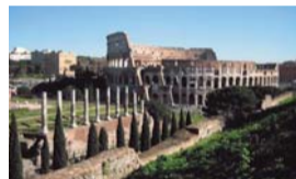
Dall'1 al 4 Settembre ROMA, TRA ARTE E STORIA

Info e prenotazioni: 0383.804175 (orari ufficio) o 347.8750285