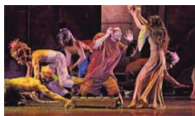
29 O 30 Giugno NOTRE DAME DE PARIS A SAN SIRO