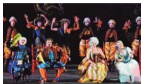
Venerdì 22 Luglio IL BARBIERE DI SIVIGLIA ALL'ARENA DI VERONA