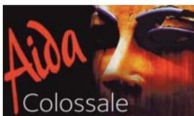
Sabato 11 Giugno AIDA ALLO STADIO SAN SIRO DI MILANO