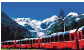
Domenica 10 Luglio TRENINO DEL BERNINA