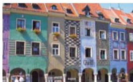
Dal 2 al 7 Agosto TOUR POLONIA